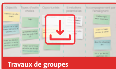
Travaux de groupes