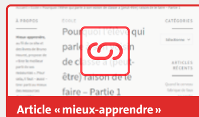
Article « mieux-apprendre »