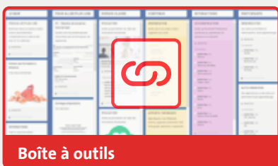
Boîte à outils