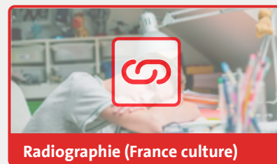
Radiographie (France culture)